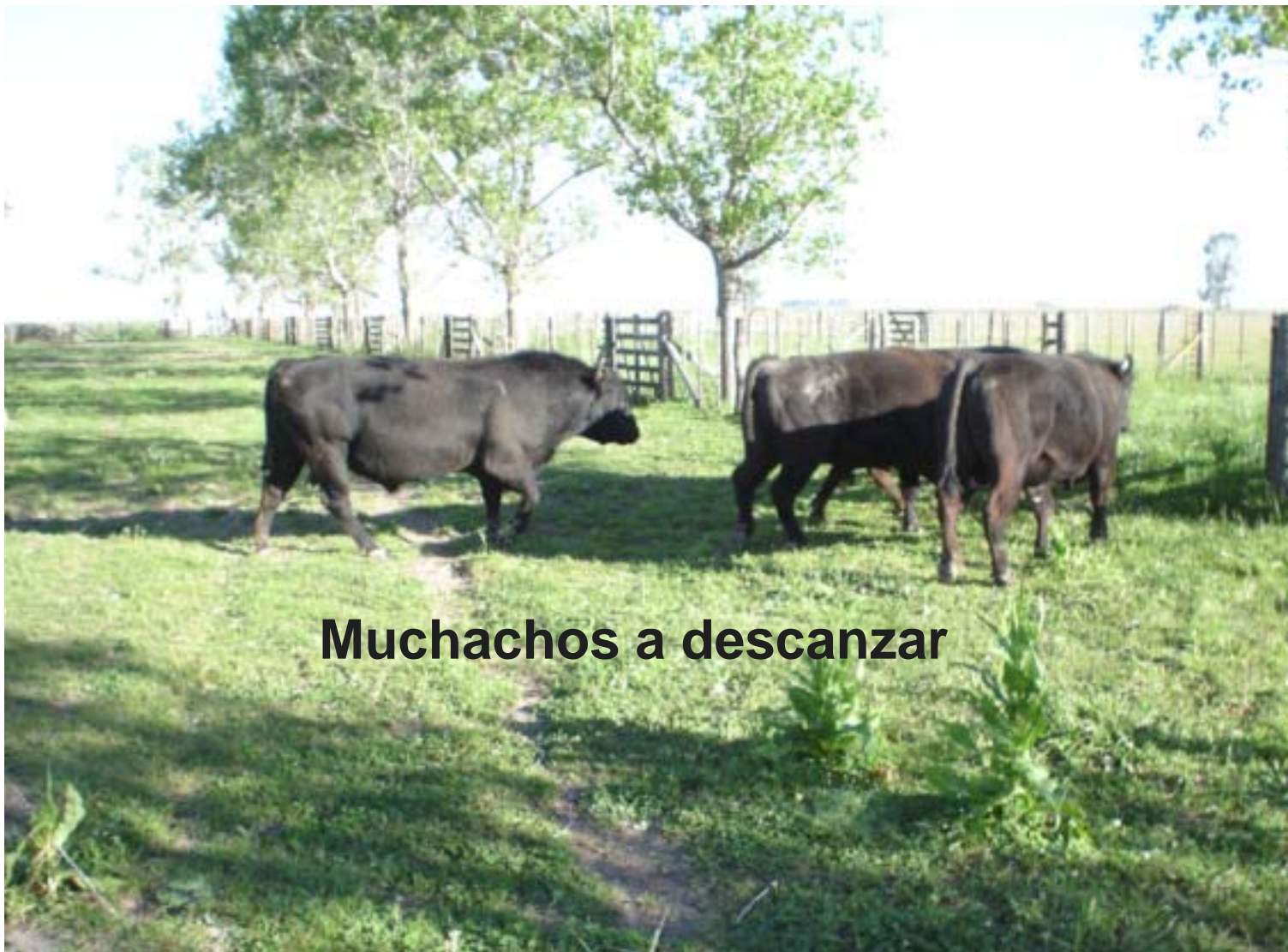
Muchachos a descansar